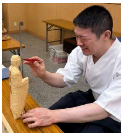
仏師の仏像彫刻体験コーナー